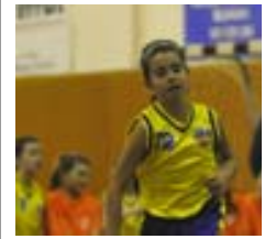
Equip Mini femení de l'Escola Pia